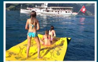
Spass haben & spielen