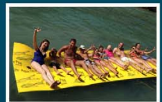
Party auf dem Wasser