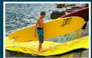
Wassersportarten aller Art