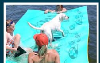
Spass für Mensch & Tier